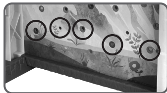
Εικ.3 Σημείο αφετηρίας για το δεύτερο ορειβάτη ή για αυτόν που θα πέσει από το βουνό κατά τη διάρκεια του παιχνιδιού.