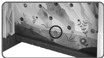
Εικ.2 Σημείο αφετηρίας για τον πρώτο ορειβάτη.

Όταν αρχίσει η ανάβαση των ορειβατών στο βουνό, θα χρειαστεί να παίξετε με ακρίβεια και στρατηγική και να επιλέξετε καλά τα σημεία στα οποία θα σκαρφαλώσουν αλλά και το μονοπάτι που θα ακολουθήσουν. Πρέπει να είστε πολύ προσεκτικοί γιατί οι ορειβάτες του αντιπάλου σας ανεβαίνουν από την άλλη πλευρά του βουνού και μπορεί να σας ρίξουν κάτω!